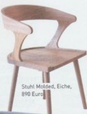
Stuhl Molded, Eiche, 890 Euro