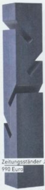
Zeitungsständer Jog, 990 Euro