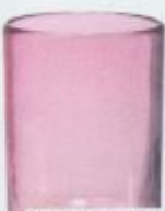
Karaffe und Trinkglas der Casual-Kollektion, 69 und 29 Euro