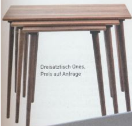
Dreisitztisch Ones, Preis auf Anfrage

Die Möbelkollektion wird nach eigenen Entwürfen in Deutschland gefertigt. Die Hölzer werden von Artidentity persönlich ausgesucht, danach für die Produktion vorbereitet. Heimisches Eichenholz, Nussbaum, Robinie und Kastanie werden in ihrer ursprünglichen Form oder geräuchert weiterverarbeitet.