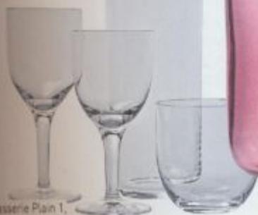
Gläserie Plain 1, ab 35 Euro