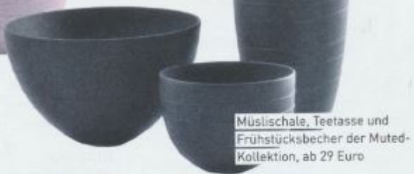
Mülschale, Teetasse und Frühstückstbecher der Muted-Kollektion, ab 29 Euro