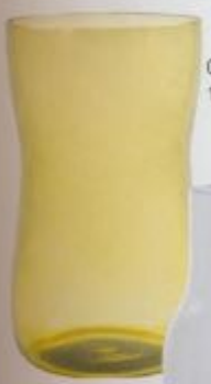
Glasvase, 185 Euro

Die handgemachten, mundgeblasenen Gläser werden von erfahrenen Glasmachern hergestellt. Nach dem Entwurf des Glases wird die Form aus Buchenholz gedreht. In diese Holzform bläst der Glasmacher das zuvor dem Glasofen in mehreren Schritten entnommene heiße Material.