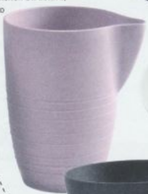
Milchkännchen Structure, 32,50 Euro