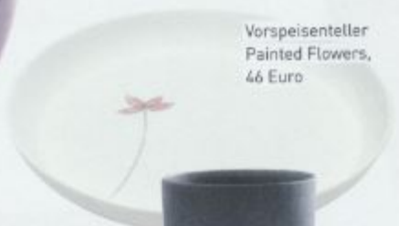
Vorspeiseteller Painted Flowers, 46 Euro