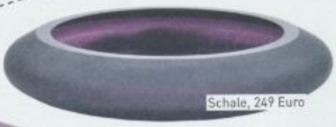
Schale, 249 Euro