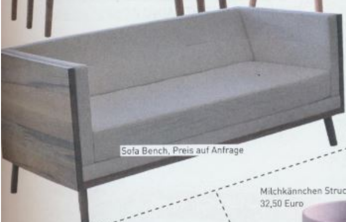
Sofa Bench, Preis auf Anfrage