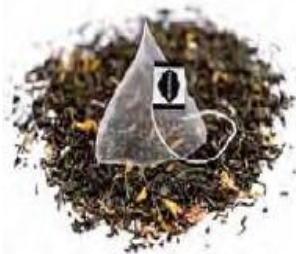
Der Tee von Mistral schmeckt nicht nur besser als andere aus dem Beutel. Er riecht auch viel intensiver.

Die 50 Cent, die man über die App FairBuy los wird, sollen nicht an Zara oder H&M gehen, sondern direkt an die Textilarbeiter.