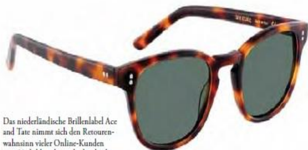
Das niederländische Brillenlabel Ace and Tate nimmt sich den Retourenwahnsinn vieler Online-Kunden zum Vorbild und verschickt gleich vier verschiedene Modelle.