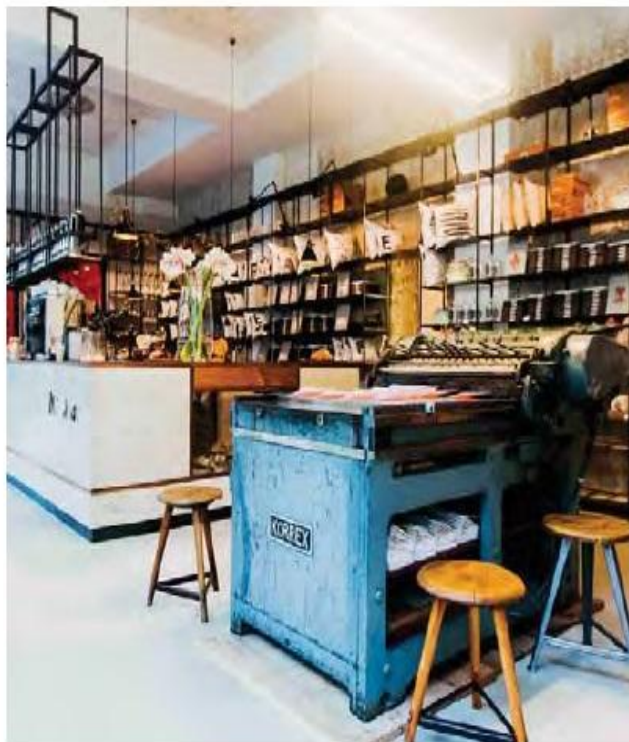
Wer ein Kissen mit Initialen mag, der wird bei Type Hype in Berlin stundenlang stöbern können.