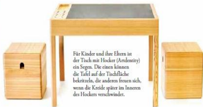
Für Kinder und ihre Eltern ist der Tisch mit Hocker (Artidentity) ein Segen. Die einen können die Tafel auf der Tischfläche bekritzeln, die anderen freuen sich, wenn die Kreide später im Inneren des Hockers verschwindet.